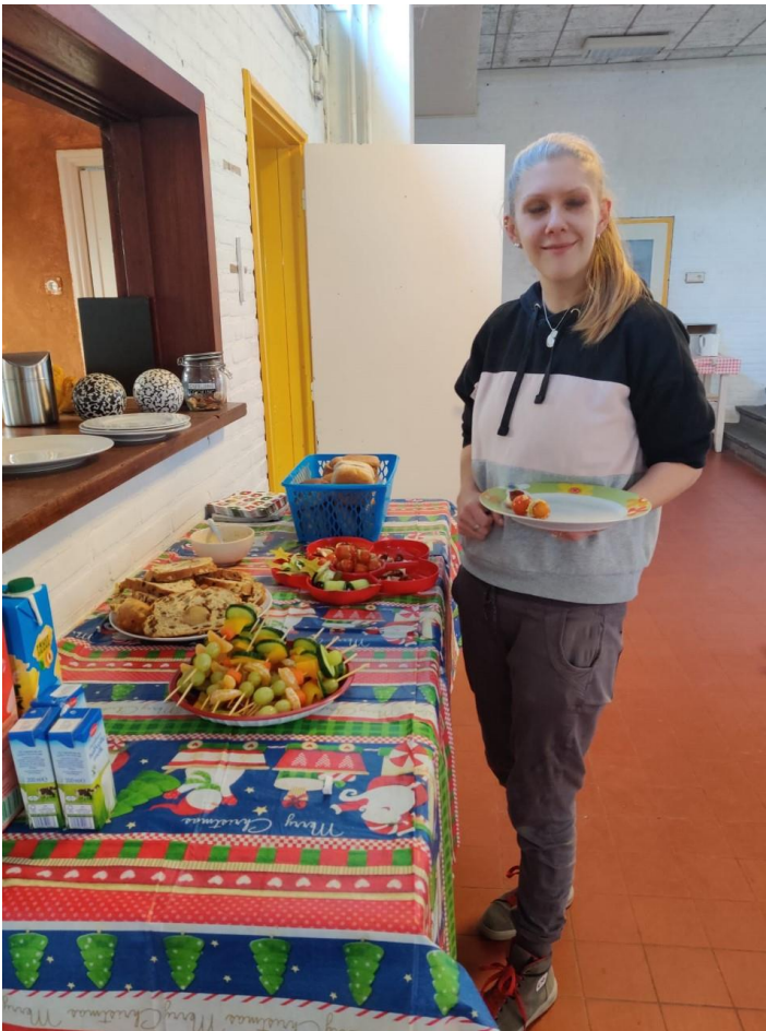
De kerst lunch