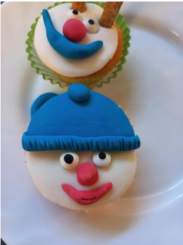
Cub Cake versieren