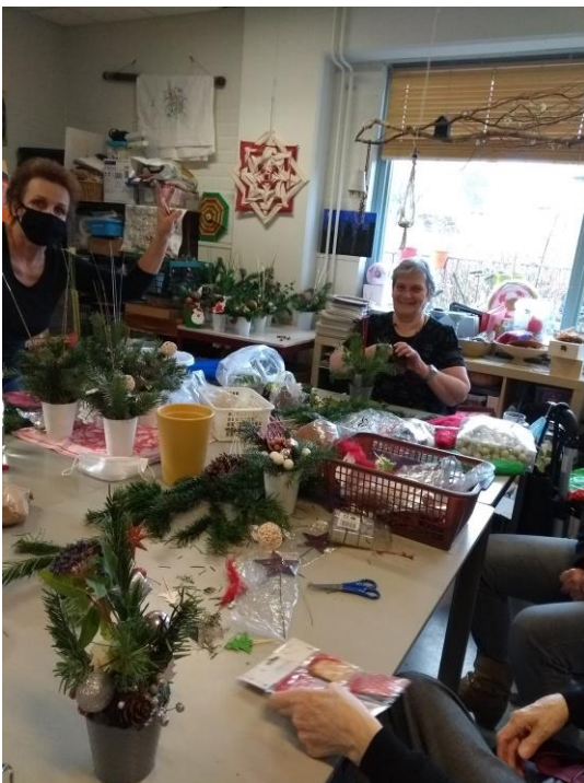
Kerst stukjes maken